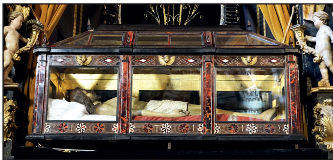
Cristo Yacente en su valiosa urna